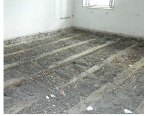
Rimozione e recupero dei listoni in rovere, apertura dei tavolati superiori e stratificazione sopratravi, svuotamento dei riempimenti di terra.