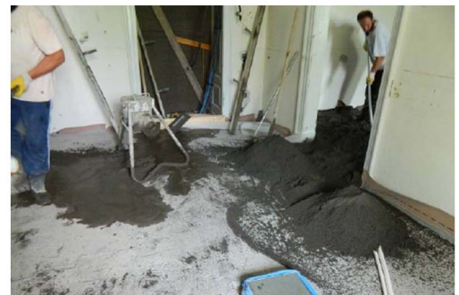
Posa delle reti e delle connessioni alle murature, getto del primo e del secondo massetto.