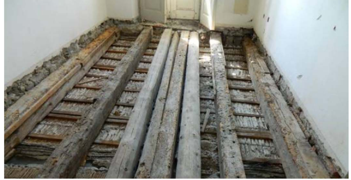
Verifica della freccia delle travi durante lo svuotamento, svuotamento meccanico, strutture lignee portate a nudo.