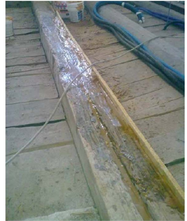
Ripristino delle zone corrispondenti all'ascensore preesistente, trattamento antitarlo, ricostruzione delle lacune con resine.