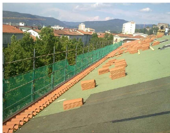
Posa del pacchetto di sottomanto, posa dei listelli di sottogronda, posa della membrana ardesiata e del manto in coppi.