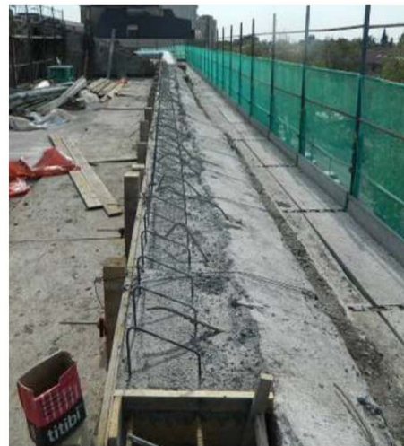
Demolizione, rimozione delle tavelle interne al cornicione, getto del cordolo perimetrale.